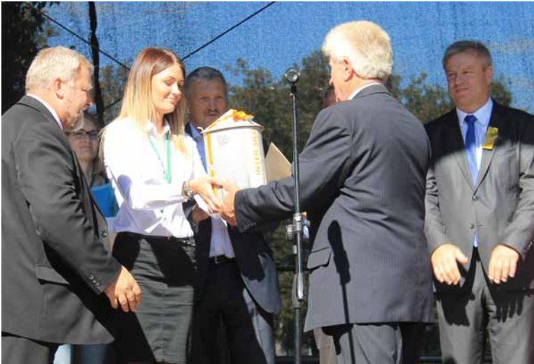
„Inter-Silo“ šventėje „Derlius 2014“.

2014-ųjų derliaus sezonas grūdų bokštų montavimo kompanijai „Inter-Silo“ buvo itin sėkmingas. Šiame 13 kompanijų komandų sumontavo 105 įvairių dydžių grūdų sandėliavimo bokštus, kurių bendra talpa – apie 123 000 tonų.